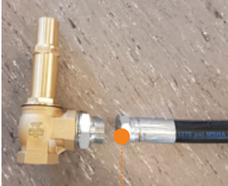
Koble fra slange

Sugeslangen kobles fra antihevert ventil som vist under.