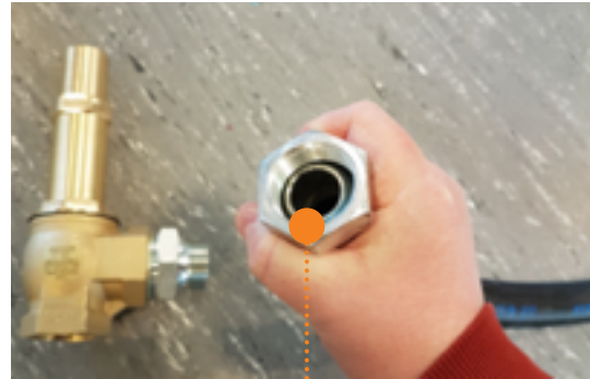
Fyll på diesel

Diesel fylles ned i sugeslange og denne kobles til antihevert ventil igjen. Nå skal pumpen ha fått nok diesel til å komme i gang.