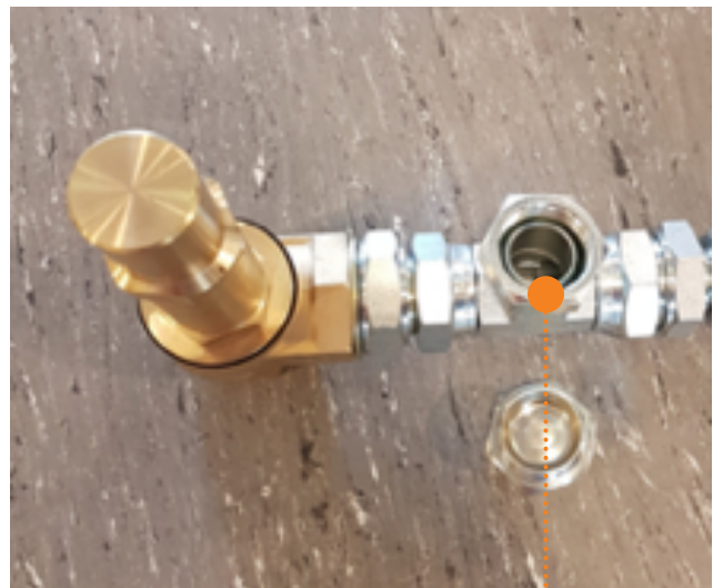
Fyll på diesel